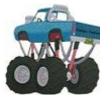
Reifen Haberl Sachsenkam